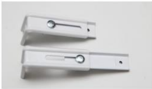
Стеновые кронштейны - максимальный вынос 120мм